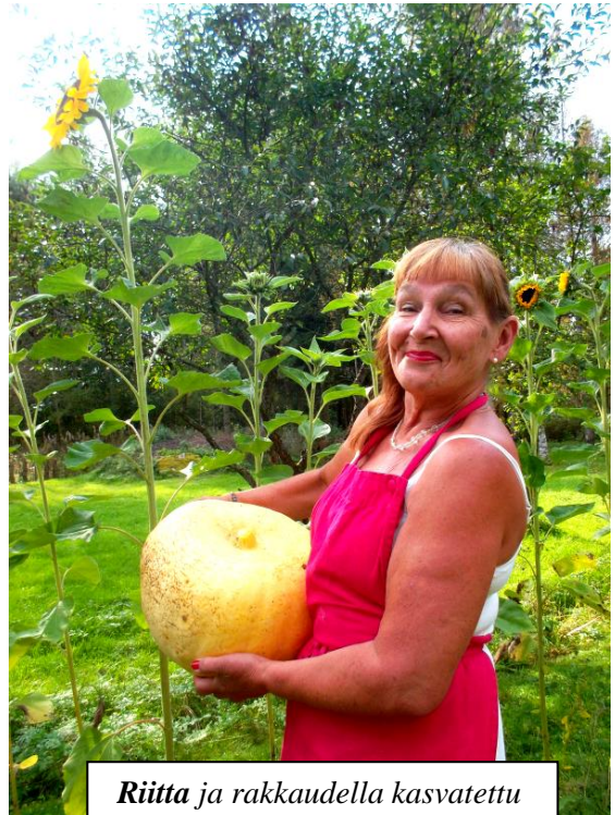
Riitta ja rakkaudella kasvatettu voittokurpitsa

osta hyvä taimi torilta ja istuta se lämpimään, aurinkoiseen ja suojaiseen paikkaan, esimerkiksi kompostin päälle. Älä kastele liikaa!